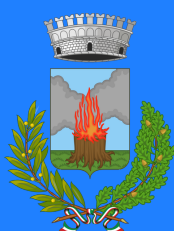
Comune di Ferno