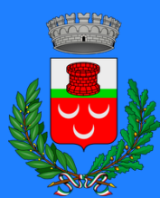
Comune di Lonate Pozzolo