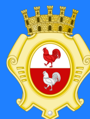
Comune di Gallarate