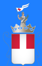
Comune di Varese