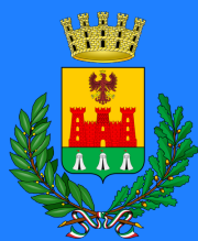
Comune di Cardano al Campo

Con il coinvolgimento dei Comuni che hanno contribuito alla realizzazione e alla posa del Monumento ai Caduti Senza Croce